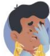
INSUFICIENCIA RESPIRATORIA AGUDA